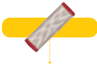
Filtro com malha de aço inoxidável.