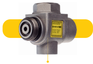
Corpo em alumínio injetado.